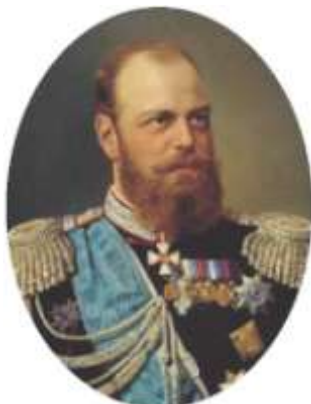
Император Александр III