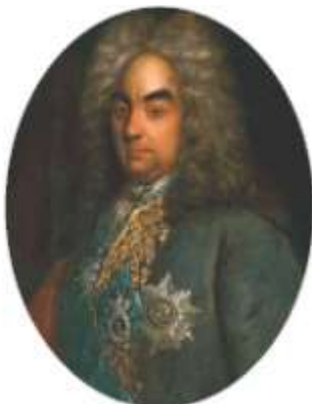
Петр Андреевич Толстой