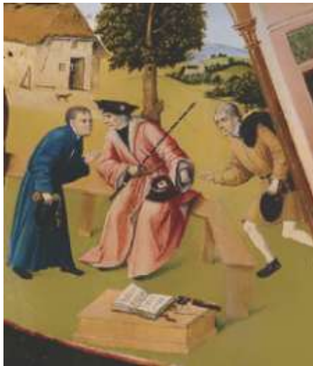
Фрагмент «Алчность» картины Иеронима Босха «Семь смертных грехов»

Рассматривая участников коррупции на примере взяточничества, стоит отметить, что в коррупционном процессе всегда участвуют две стороны. Одна сторона — это взяткополучатель (подкупаемый). Вторая сторона — это взяткодатель (осуществляющий подкуп). Также в процессе может участвовать и третья сторона — посредник.