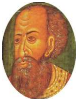
Царь Иван IV Грозный