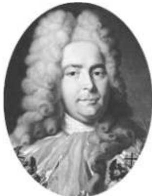
Генерал-прокурор Павел Иванович Ягужинский